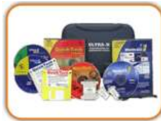
QUICK TECH PRO