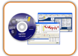
WIN STRESS TEST