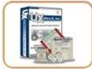
QUICK TECH Personal